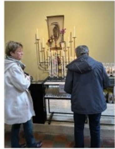
opsteken kaarsen in Heiloo

Druk bezochte kinderkerstviering in de H. Nicolaas Parochie feest met eigen gebakken taarten Regiobedevoart naar Heiloo Kerstwandeling gerealiseerd samen met de Grote Kerk langs taferelen van het kerstverhaal.