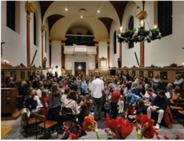
Kerstviering H. Nicolaaskerk